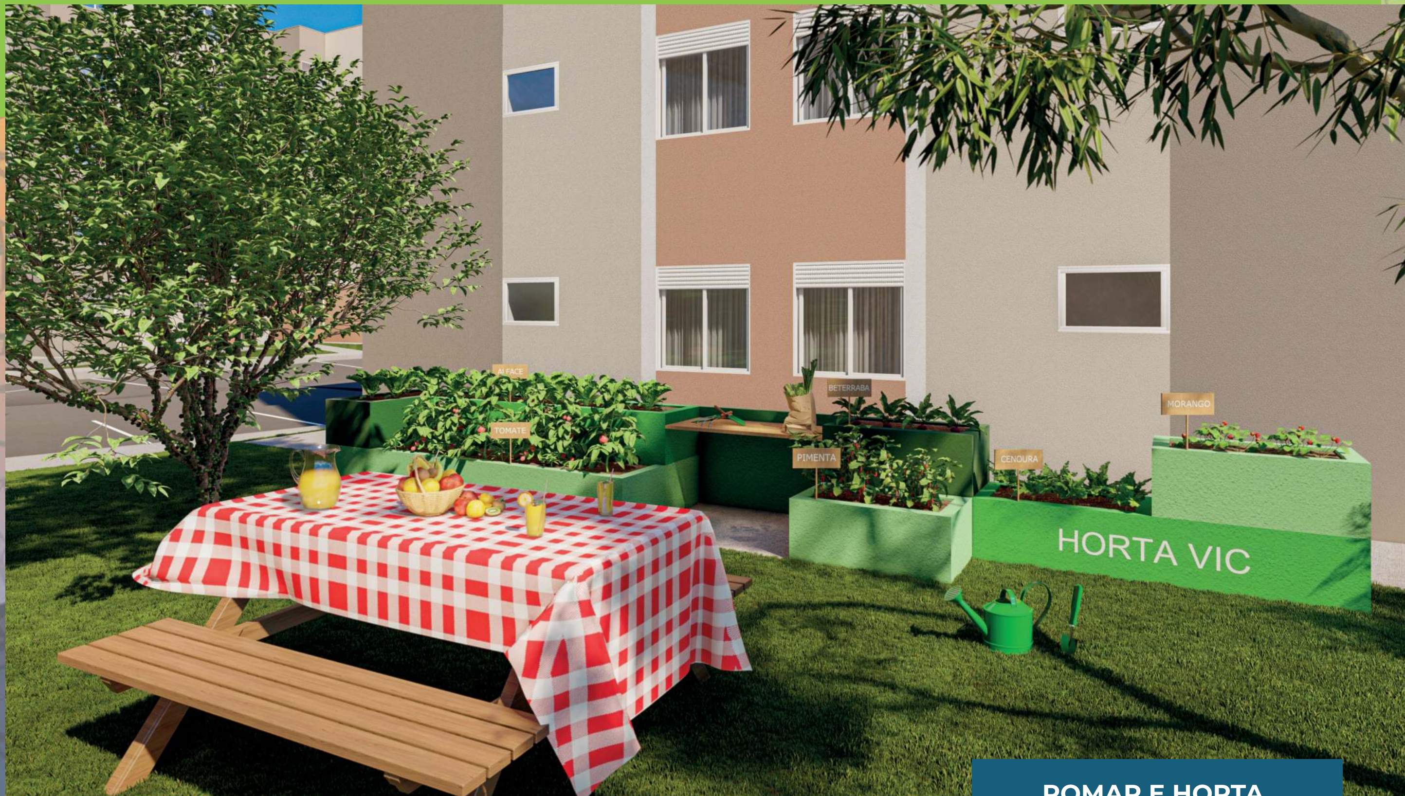
POMAR E HORTA